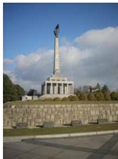
Bratislava - Slavín - pôdorys, ilustračné foto