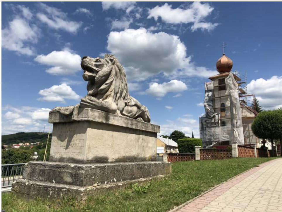
Fotografia: Pamätník obetiam prvej svetovej vojny. Kamenná plastika ležiaceho leva z roku 1918. Najznámejšia umelecká pamiatka Giraltoviec sa nachádza pred gréckokatolíckym kostolom pri vstupe do mesta od Prešova.