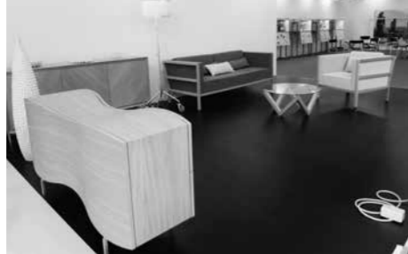
Fórum dizajnu, nábytok Ivana Čobeja, 2013–15