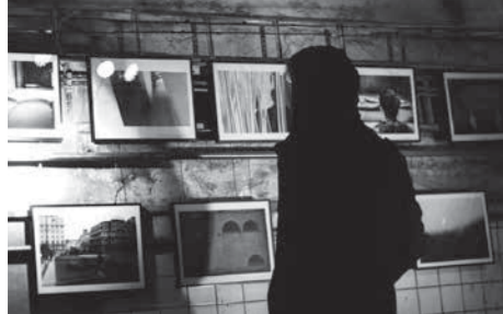
FOTO EXPO 2015