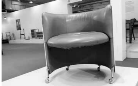
Kresielko z Vládneho salónika, Letisko Milana Rastislava Štefánika v Bratislave, autor Vojtech Vilhan, 1972 – 1973