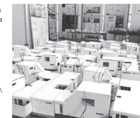
INFORMAČNÉ LISTY FAKULTY ARCHITEKTÚRY STU V BRATISLAVE #7

–Katarína Bergerová, Ústav architektúry obytných budov–