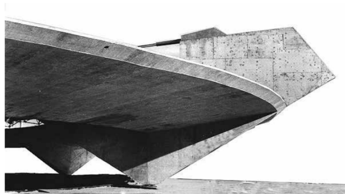
Atletický klub Paulistano, Sao Paulo 1957

Paolo Baratta prezident benátskeho biennale označil jeho tvorbu „za nadčasovú, ktorá sa však nikdy nemusela podriaďovať“. Hovorilo sa tiež „o fyzickej a štylistickej nadčasovej architektúre“ a o tom, že prekvapujúca konzistencia architektúry bola výsledkom „jeho ideologickej integrity štruktúrného génia“. No viac, než Mendesova imponantná betónová architektúra zaujala komisiu „angažovanosť pri riešení sociálnych otázok v Latinskej Amerike“. A preto sa v roku 2016 stal držiteľom Zlatého leva 15. ročníka benátskeho biennale architektúry za celoživotné dielo.