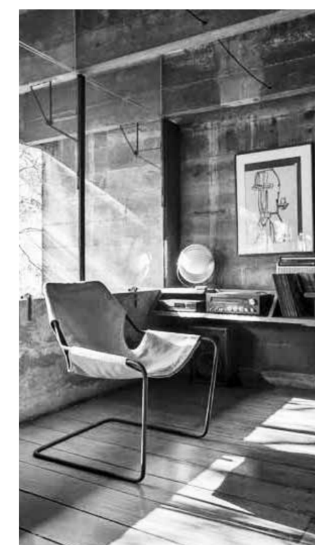
Interiér Casa Bultanta, Sao Paulo, 1964.