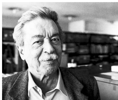
Paulo Mendes da Rocha