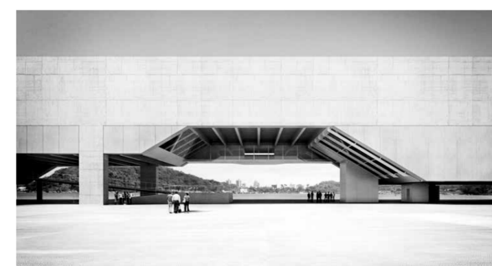
Galéria Cais das Artes, Vitória, / Paulo Mendes da Rocha.