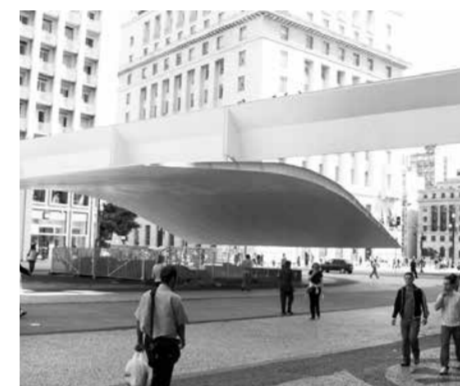
Patriarch Plaza / Paulo Mendes da Rocha