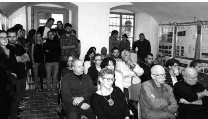
–red. Foto: Dalibor Kastrá –

Podujatie sa konalo vďaka finančnej podpore Ministerstva kultúry SR v rámci ARCH+A days a Dní európskeho kultúrneho dedičstva.