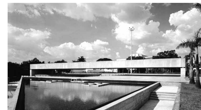
MuBE / Paulo Mendes da Rocha