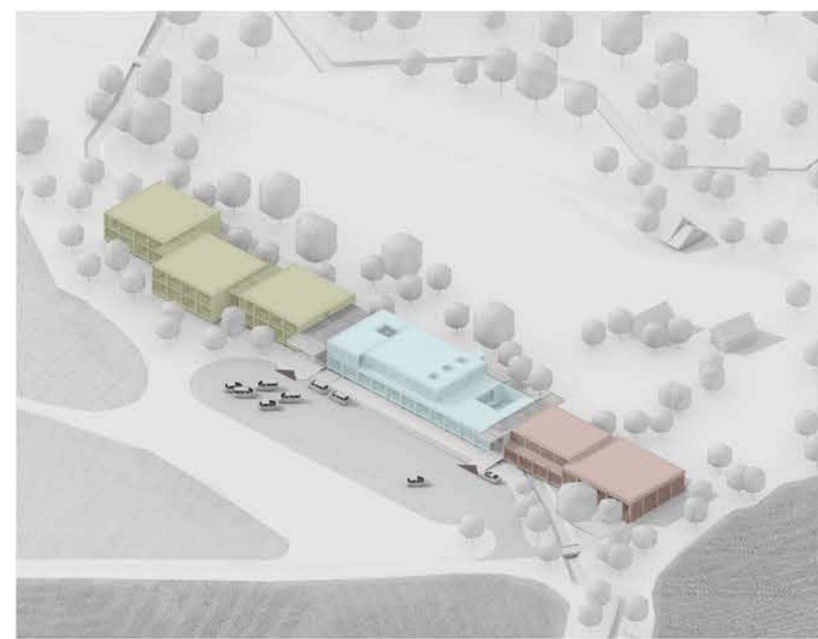
AXONOMETRIA S FUNKČNÝM DELENÍM