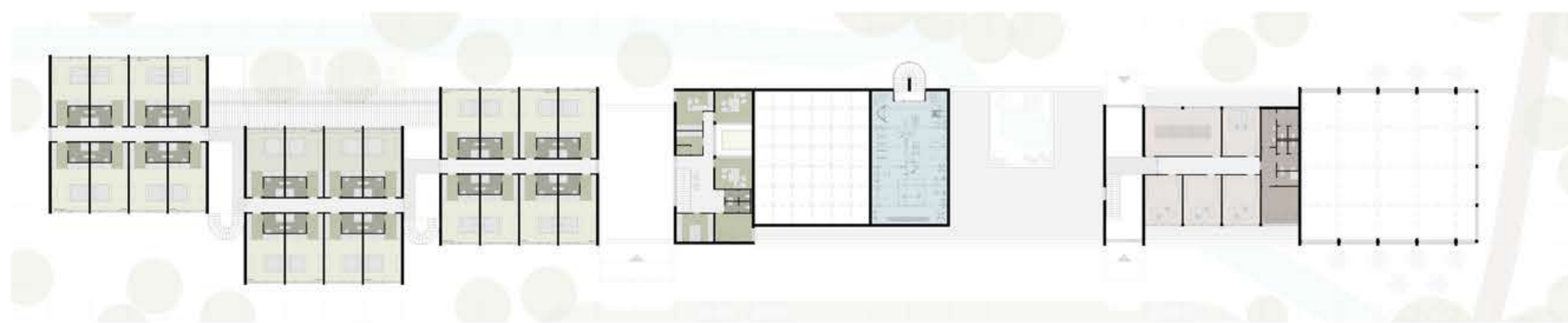
PÓDORYS DRUHÉHO PODLAŽIA